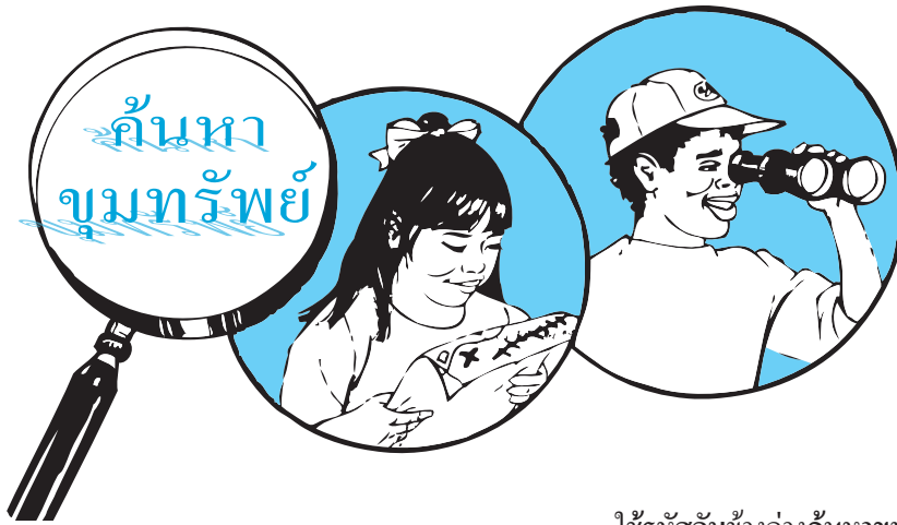
ใช้รหัสลับข้างล่างค้นหาขุมทรัพย์

ก ○ ข ● ง ⊖ จ ⊖ ค ⊕ ย ⊘ พ ⊘ ร ⊗ ว ⊖ ส ⊖ อ ⊖